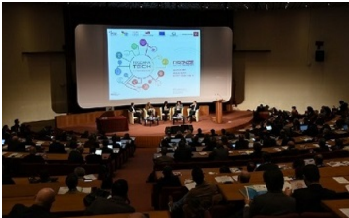
Un'istantanea di Toscana Tech

settore tessile-Regiotex , Industria 4.0 e PMI e alla Digitalizzazione del Turismo . L'evento Toscana Tech , appuntamento con i protagonisti dell'innovazione e della tecnologia in Toscana che si è tenuto nel mese di febbraio a Firenze, è stato il palcoscenico durante il quale è stata lanciata la piattaforma Industria 4.0 e PMI . #ToscanaBXL ha supportato le Direzioni competenti nel processo di candidatura e successivamente inserimento della stessa nel Catalogo dei DIH, Digital Innovation Hub , curato dalla DG Connect della Commissione Europea, vale a dire gli eco-sistemi in grado di supportare le imprese, e in particolare le PMI, ad adeguarsi alle sfide poste dalla nuova rivoluzione industriale.