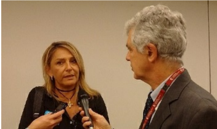
Assessore Istruzione, formazione e lavoro Cristina Grieco

illustrato l'esperienza di GiovaniSi , comparandola con le migliori esperienze nazionali in tema di Garanzia Giovani . In tale occasione è stata presentata la pubblicazione " Click " che "fotografa" le politiche giovanili in Europa. #ToscanaBXL ha supportato l'Assessore Grieco durante l'iniziativa e ha assicurato un'importante copertura mediatica.