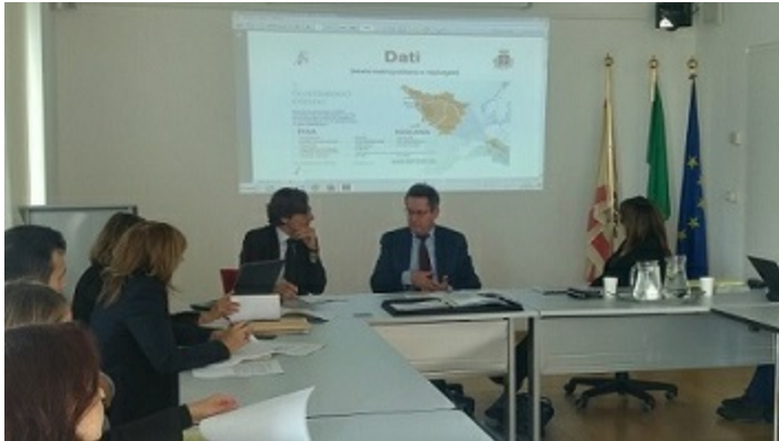
Sindaco di Pisa Marco Filippeschi

risultati del Master Plan del Comune di Pisa . Durante l'evento che si è tenuto a Bruxelles il 26 Settembre 2017, si è lanciata la proposta di un nuovo Master Plan incentrato sul tema della mobilità sostenibile.