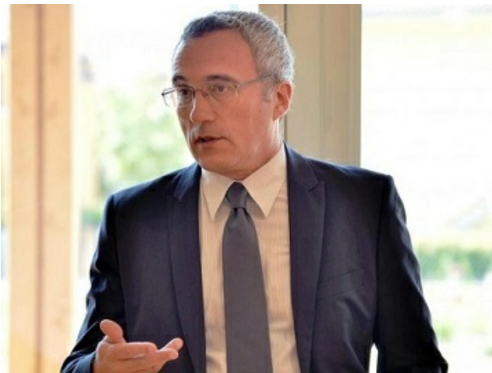
Assessore alla Presidenza Vittorio Bugli

#ToscanaBXL ha sostenuto politicamente l'Assessore Vittorio Bugli nell'incontro con i referenti della DG Migration and Home Affairs della Commissione Europea e della Rappresentanza Italiana presso l'Ue per lo scambio di buone pratiche e in particolare per promuovere il modello toscano della accoglienza diffusa. Ha facilitato inoltre la partecipazione e il patrocinio della Commissione europea all'evento " #AccoglienzaToscana – Libro bianco sulle politiche di accoglienza e inclusione dei migranti " che si è tenuto a Firenze, organizzato dalla Regione Toscana con ANCI Toscana.