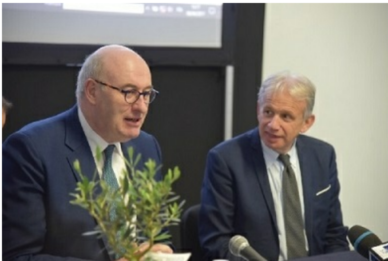
Commissario Europeo all'Agricoltura Phil Hogan con l'Assessore all'Agricoltura Marco Remaschi

Questo strumento finanziario, è stato firmato l'8 aprile a Verona, alla presenza del Commissario all'Agricoltura Phil Hogan. Il Programma di Sviluppo Rurale (PSR) della Regione Toscana contribuisce al fondo di garanzia multiregionale per un ammontare di 10 milioni di euro, mentre l'ammontare complessivo interregionale è di circa 80-100 milioni di euro provenienti dai PSR delle rispettive regioni aderenti.