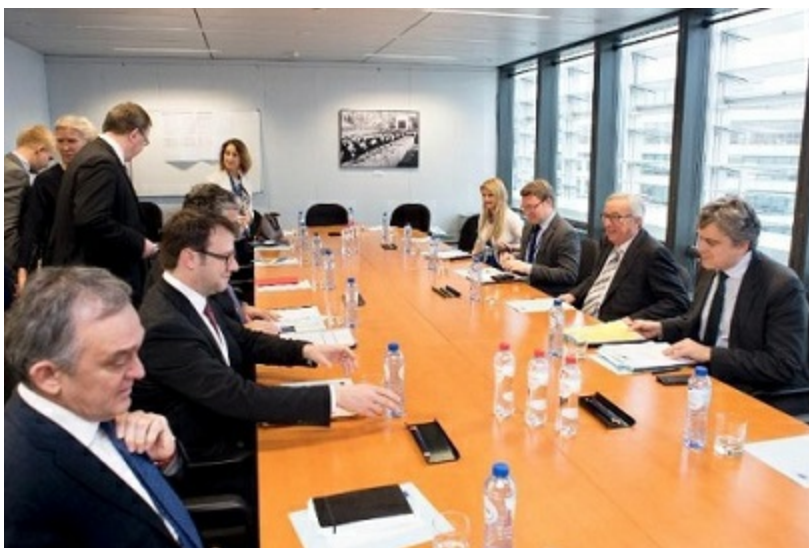
Un'istantanea dell'incontro tra la delegazione CRPM e il Presidente