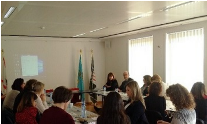
Un tavolo di lavoro dell'evento Wise4All

#ToscanaBXL ha contribuito al programma dell'evento a Firenze PROMIS, La Sanità delle Regioni in Europa e nel Mondo, l'Europa e il Mondo nei Sistemi Sanitari delle Regioni italiane Struttura, strumenti e attività. Quali opportunità per il territorio toscano? che ha visto la presenza dell'Assessore Stefania Saccardi e il coinvolgimento del delegato Nazionale Horizon2020, la Prof.ssa Angela Santoni.