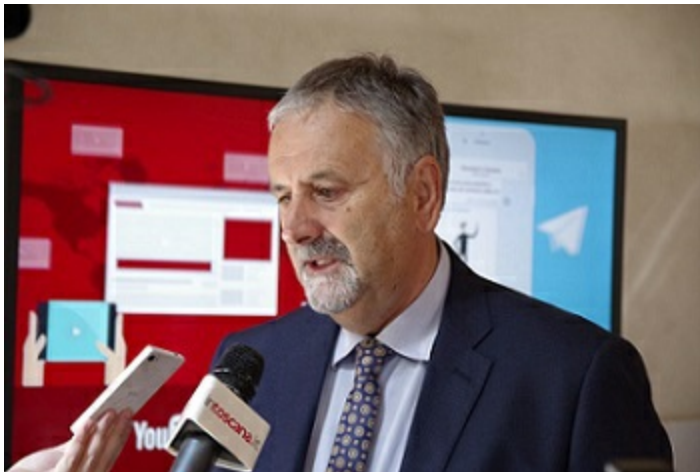
Assessore Infrastrutture, mobilità, urbanistica e politiche abitative Vincenzo Ceccarelli

Modernizzazione industriale. Questo tema si sviluppa attraverso la partecipazione della Regione Toscana attiva alla Piattaforma RIS3 sulla MI, in particolare ai gruppi di lavoro relativi all' Innovazione nel