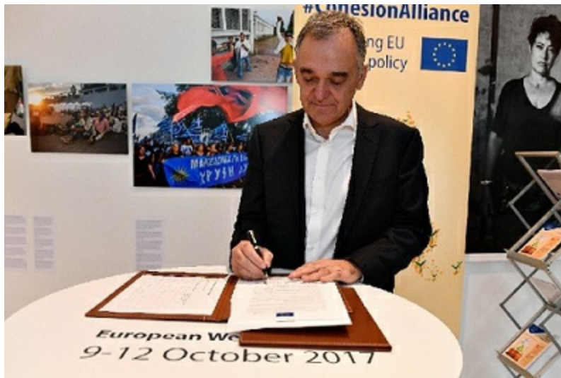
Enrico Rossi, Presidente della Regione Toscana