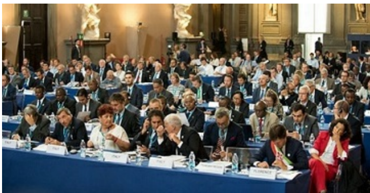
Un'istantanea della Conferenza Global Geothermal Alliance

per favorire l'energia geotermica. In particolare, è in corso una interlocuzione con altre regioni europee per la costituzione di una Rete informale di "Regioni geotermiche" con lo scopo di rafforzare il settore e definire le priorità di investimento. Si sta valutando la creazione di una partnership Geotermia nell'ambito della Piattaforma S3 Energia . A margine della GGA - High Level Conference of the Global Geothermal Alliance che si è tenuta a Firenze l'11 settembre 2017, #ToscanaBXL ha supportato la Direzione Energia nell'organizzare un primo meeting di regioni europee pronte a destinare delle risorse europee su progetti geotermici.