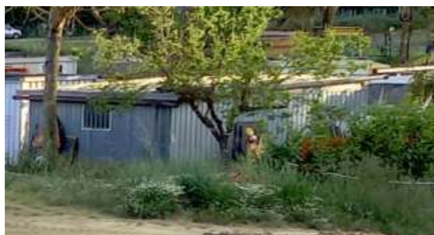
Fabbricato n. 1

L'area del fabbricato n.1 non era inclusa totalmente nel vincolo preordinato all'esproprio, su istanza della proprietaria di acquisizione completa dell'area( nota prot. N 5123 del 27/2/2019 ), tenuto conto della parte che in maniera residua sarebbe rimasta alla proprietà e della vicinanza del piccolo fabbricato all'argine della cassa, in data 24 maggio 2019 è stato sottoscritto un accordo di determinazione dell'indennità ai sensi dell'art. 20 del DPR 327/2001, col quale si è ritenuto, a seguito di verifica della legittimità della costruzione, di accogliere la richiesta formulata acquisendo completamente l'area catastalmente identificata alle p.lle. 28 e 511 del F 142. L'area è stata utilizzata come campo base dall'impresa durante i lavori.