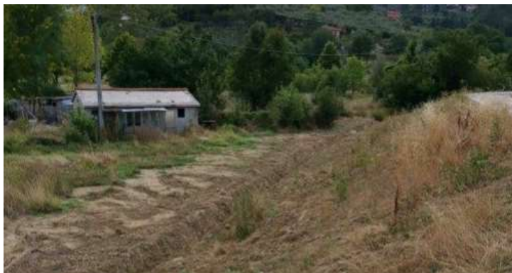
Fabbricato n. 2

FABBRICATO N.2: il fabbricato è una piccola costruzione a servizio del fondo utilizzata in passato per il ricovero di piccoli attrezzi. La costruzione di 35 mq è costituita da una struttura in muratura, appoggiata al suolo su fondazione di cemento e piccola tettoia esterna.